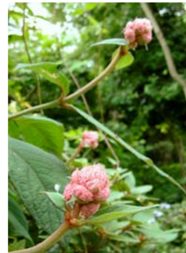
Hydrangea aspera 'Macrophylla'

De thee is op en we gaan de tuin verkennen. Ik ben vreselijk benieuwd naar het deel van de tuin dat achter het