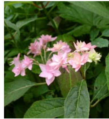
Hydrangea serrata 'Prolifera'