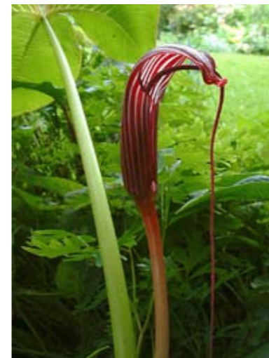
Arisaema triphyllum in bloei.