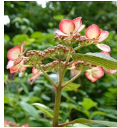
Hydrangea serrata 'Kiyosumi'

„Ik vind het het mooïst als het lijkt alsof de tuin van nature zo gegroeid is. Ondertussen is alles strak geregisseerd en hebben de planten de plaatsen die ik ze toebedeeld heb”.