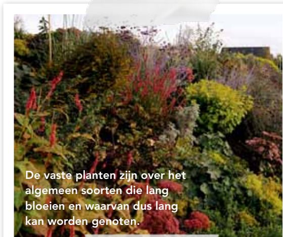
De vaste planten zijn over het algemeen soorten die lang bloeien en waarvan dus lang kan worden genoten.