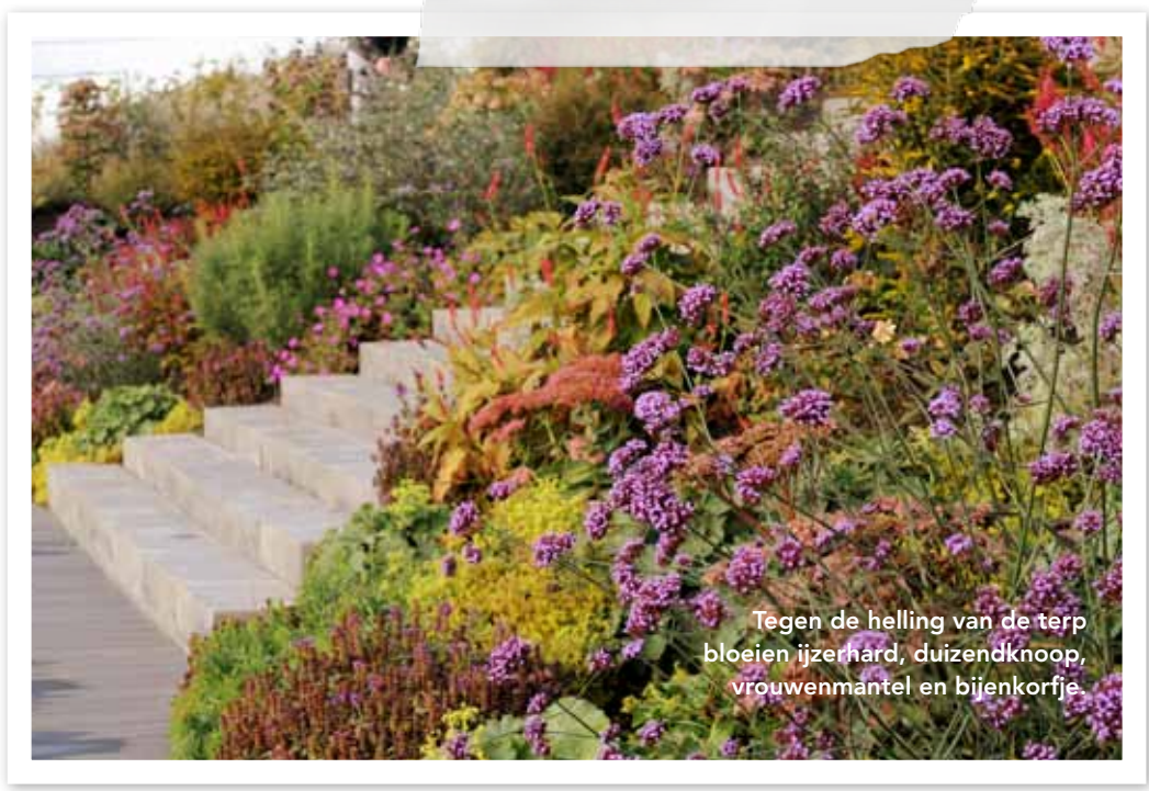
Tegen de helling van de terp bloeien ijzerhard, duizendknoop, vrouwenmantel en bijenkorfje.

Vorige maand kwam 'Paradijselijke tuinen' van Harry Pierik uit. Hier komen in foto's en tekst 9 ontwerpen aan bod die zijn aangelegd bij (semi)openbare ruimtes als een bibliotheek en museum.